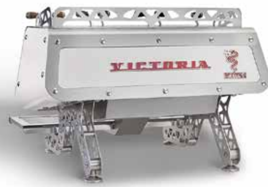
PEARL WHITE VERSION