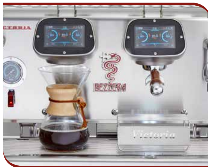
Drip coffee brewing

The new coffee extraction temperature control system by PID thermostat, allows an accurate programming of the coffee temperature in the cup, thanks to the hydraulic circuit thermo stability the exaltation of the aromas of each type of coffee is granted.