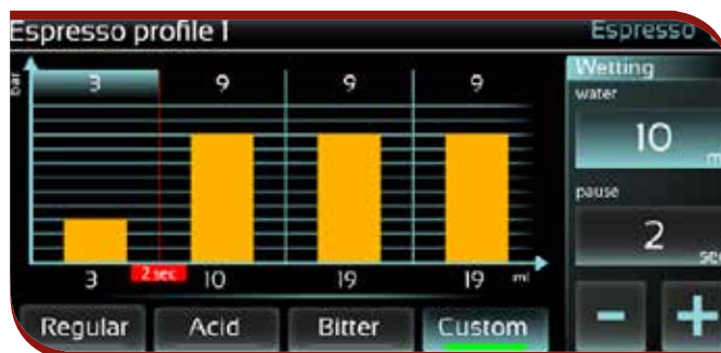
Brewing profile setting