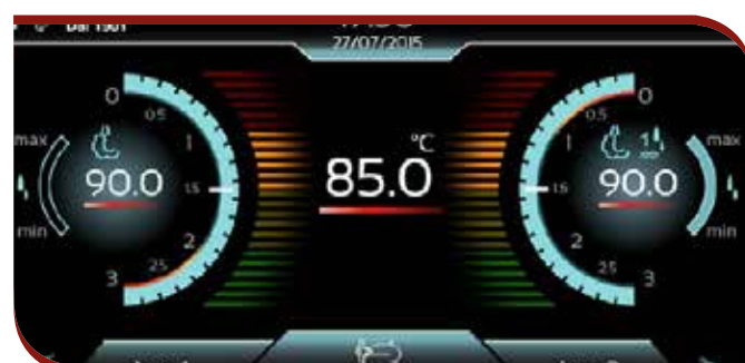
Double boiler control home page