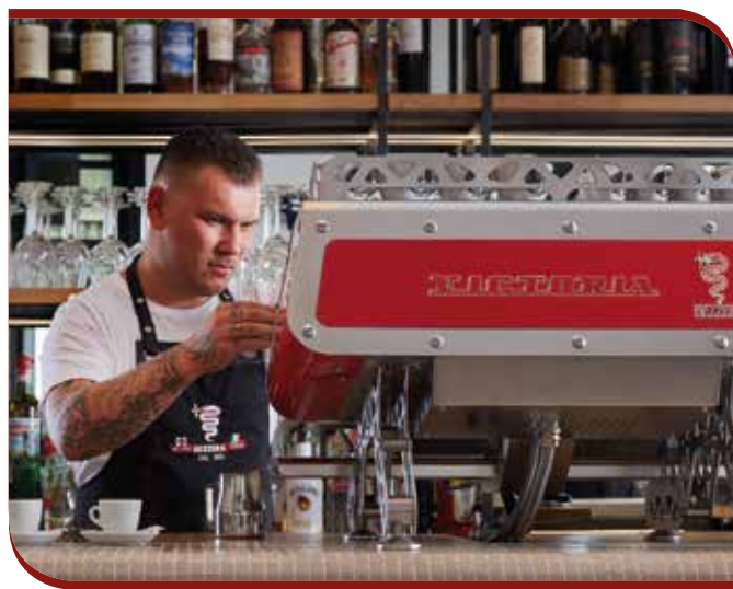
Your personal style

Le nouveau système de contrôle de température d'extraction du café par thermostat PID, permet une programmation précise de la température du café. Grâce à la stabilité du circuit hydraulique, l'exaltation des arômes de chaque type de café est garantie.