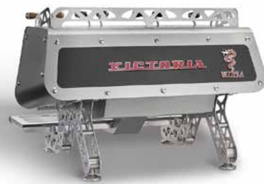
MATT BLACK VERSION